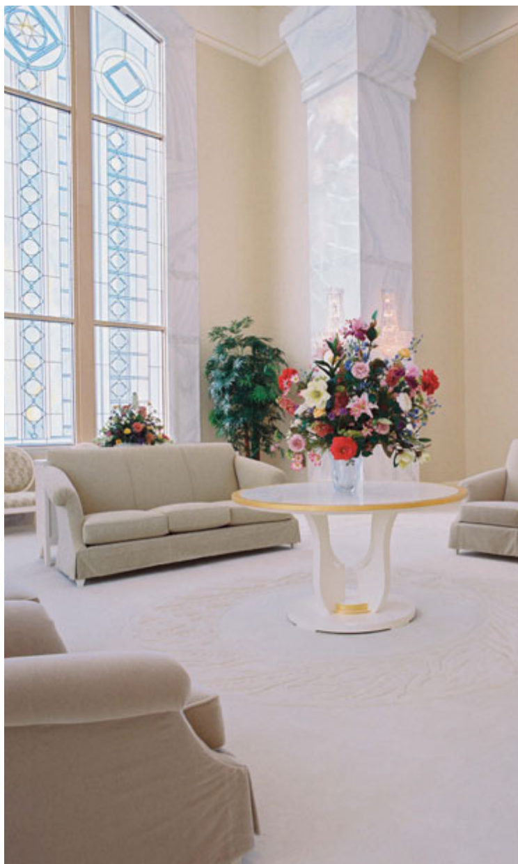
Celestijalna dvorana, hram u Columbia River, Washingtonu