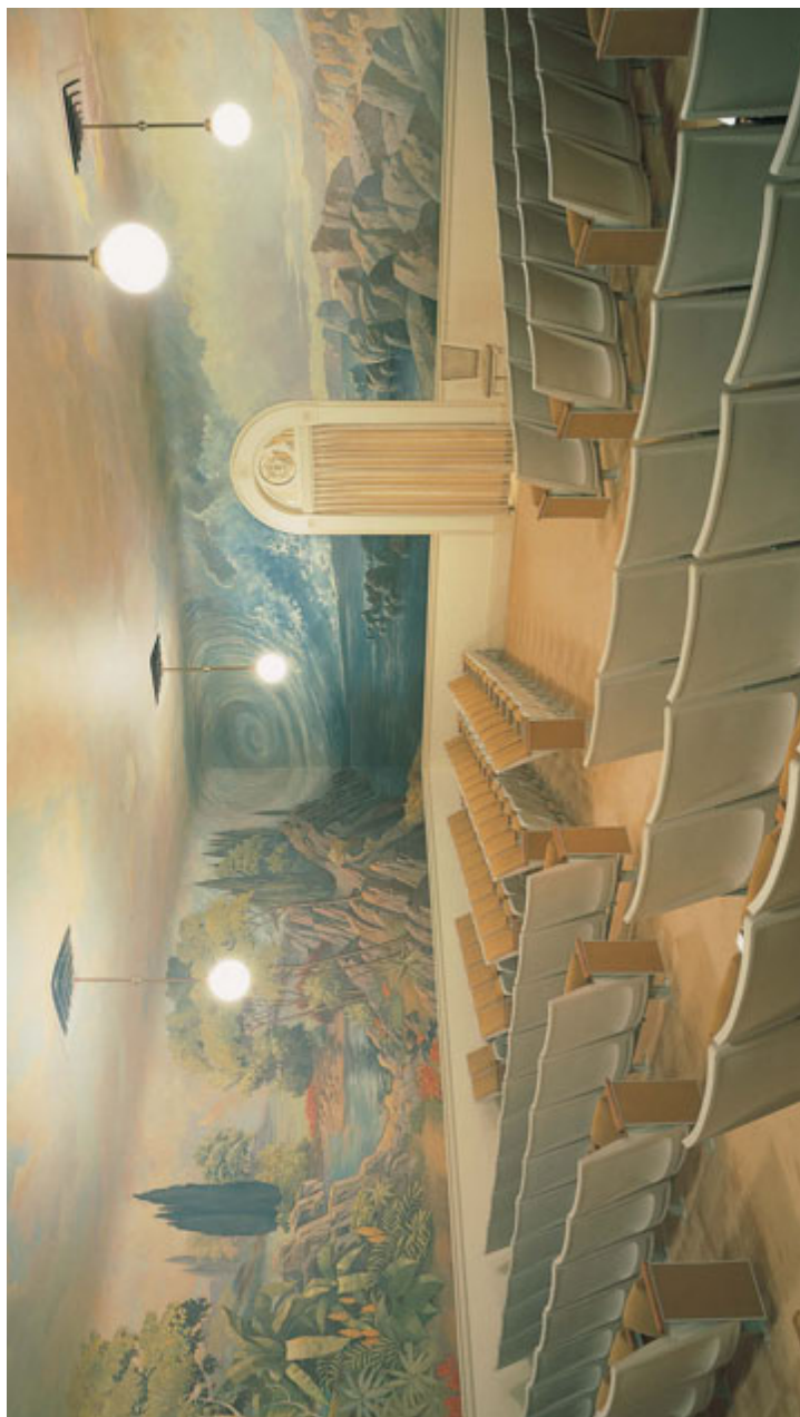
Dvorana stvaranja, hram u Salt Lake-u