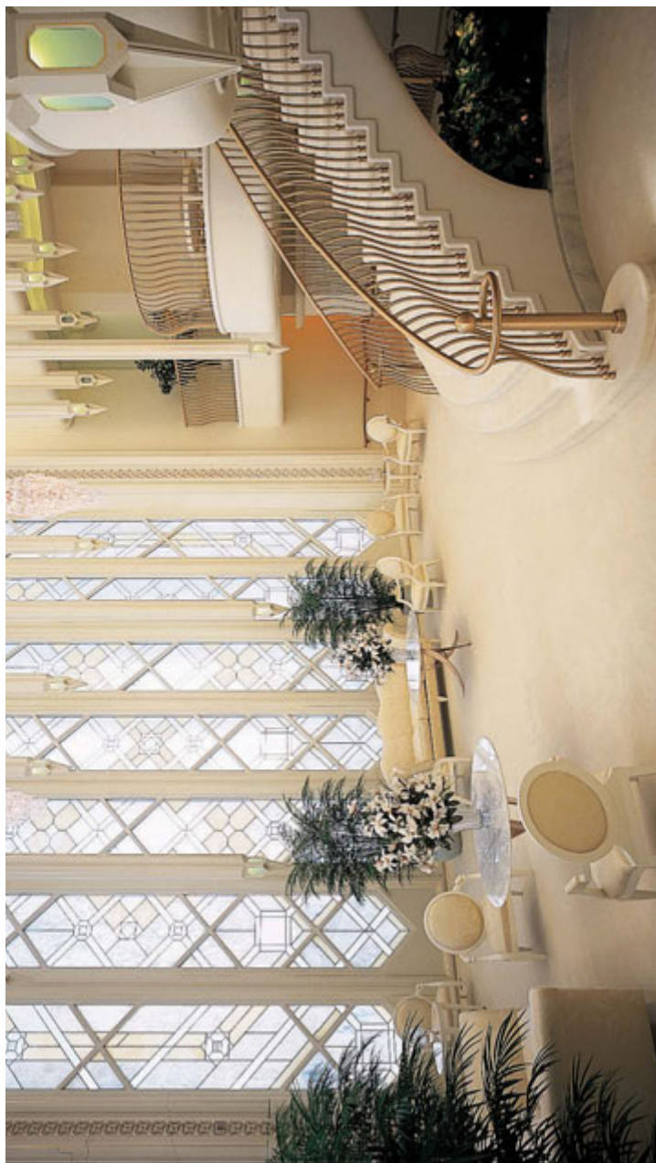
Celestijalna dvorana, hram u San Diegu, Kalifornija