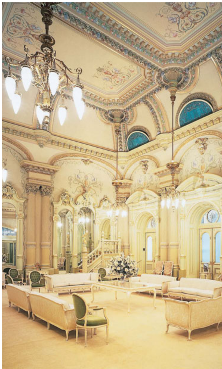
Celestijalna dvorana, hram u Salt Lake-u