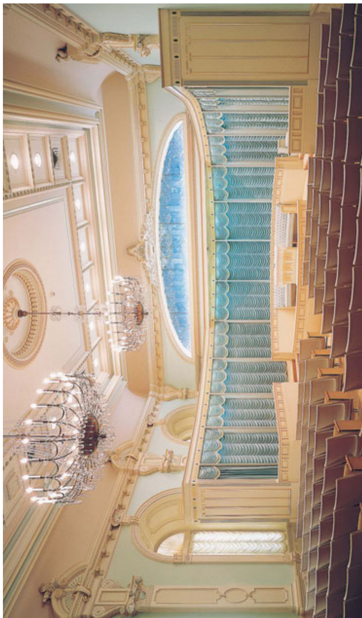
Terestrijalna dvorana, hram u Salt Lake-u