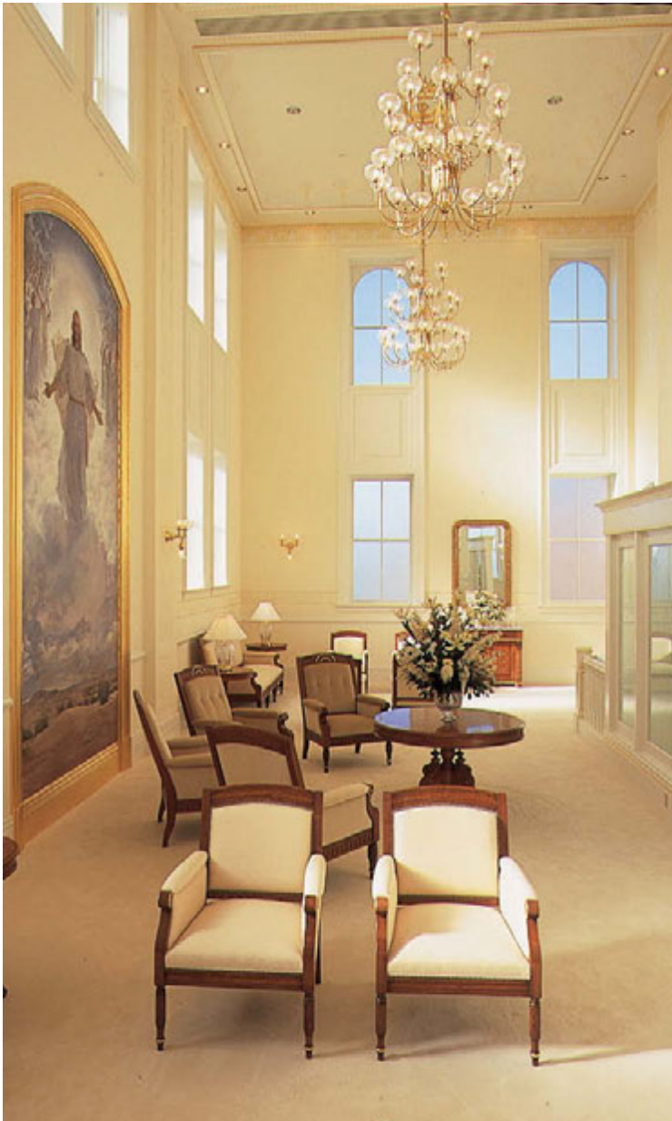
Celestijalna dvorana za pečaćenje, hram u Salt Lake-u