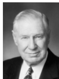
starješina James E. Faust iz Zbora dvanaestorice apostola

»These I Will Make My Leaders«, Conference Report, listopad 1980, 50-54; ili Ensign, studeni 1980, 34-37]