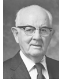
predsjednik Spencer W. Kimball