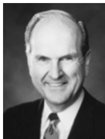
Starješina Russell M. Nelson iz Zbora dvanaestorice apostola

»Poštivanje svećeništva«, Conference Report, travanj 1993, 49-53; ili Ensign, svibanj 1993, 38-41