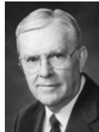
starješina M. Russell Ballard iz Zbora dvanaestorice apostola

»Strength in Counsel«, Conference Report, listopad 1993, 102-106; ili Ensign, studeni 1993, 76-78