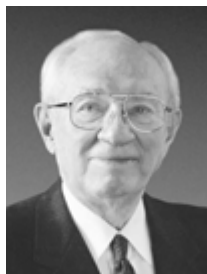
predsjednik Gordon B. Hinckley