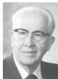
predsjednik Ezra Taft Benson

predsjednik Zbora dvanaestorice apostola