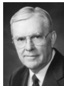
Starješina M. Russell Ballard iz Zbora dvanaestorice apostola

Ja znam da Bog živi i da Isus jest Krist. Znam da možemo bolje ostvariti njihovo djelo kroz jedinstvo i ljubav dok se sastajemo u vijećima jedni s drugima. Da budemo blagoslovljeni čineći to moja je ponizna molitva u ime Isusa Krista. Amen.