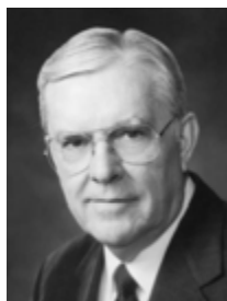
Starješina M. Russell Ballard iz Zbora dvanaestorice apostola

Pitam se je li nekako on, koji je Učitelj na nebesima i zemlji, mogao prenijeti u srce udovice svoju slatku, iskrenu zahvalnost za njezin dar.