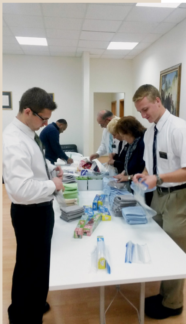
Projekt služenja u zadarskom ogranku za pomoć izbjeglicama.

Naše nam je iskustvo pomoglo obnoviti našu ljubav prema drugima i Gospodinu kada smo im na jedan mali način mogli pomoći. ■