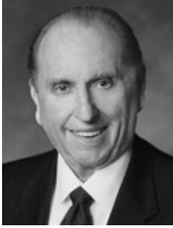
predsjednik Thomas S. Monson