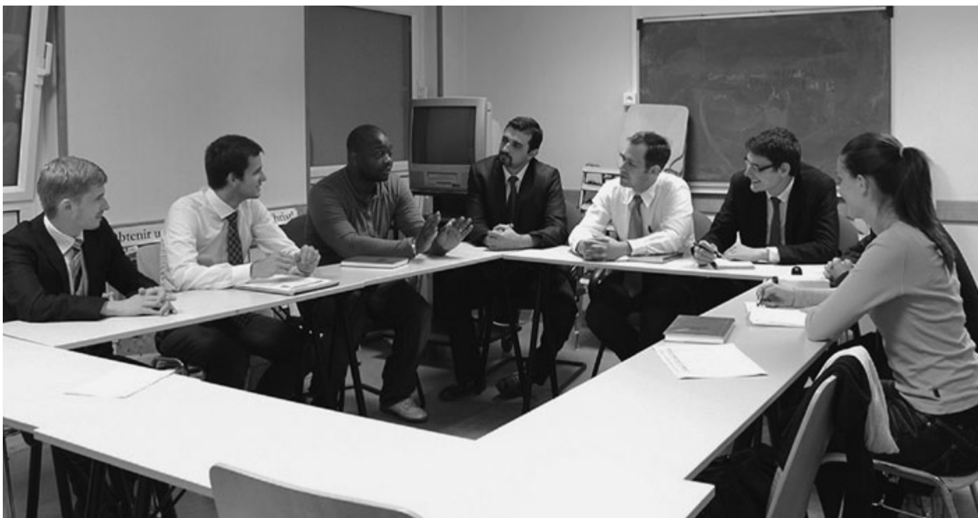
PRIVATNA FOTOGRAFIJA, OBJAVLJENA UZ DOZVOLU.