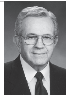
Predsjednik Boyd K. Packer, predsjednik Zbora dvanaestorice apostola