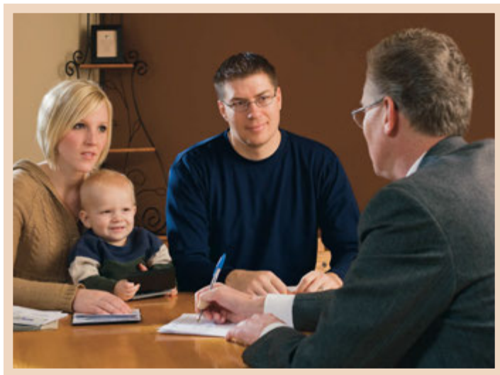
Biskupi se sastaju s članovima u potrebi i sagledavaju kako najbolje pružiti pomoć te im pomažu da si pomognu.

Biskupi su blagoslovljeni darom razlučivanja da bi razumjeli kako najbolje pomoći onima