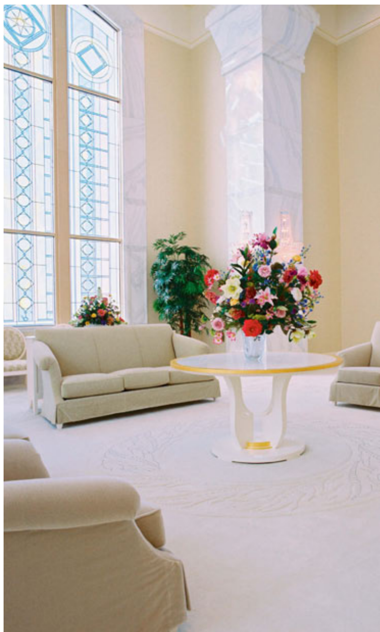
高榮室，華盛頓州哥倫比亞河聖殿