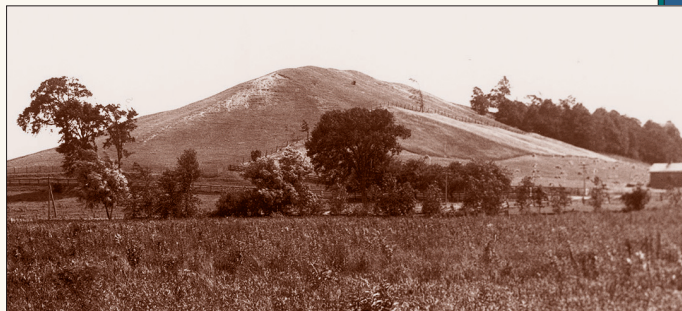
Ang Bungtod sa Cumorah mga lima ka kilometro sa habagatan-silangan sa umahan sa mga Smith sa Palmyra, New York. Sa panahon ni Joseph ang tumoy sa amihanan napuno sa mga sagbot, ang habagatan napuno sa nagkatag nga mga kahoy ug mga kalasangan. Ang mga palid gilubong diha sa habagatan-kasadpan nga bahin, dili layo gikan sa ibabaw. Hulagway: Agosto 1907

Niini nga higayon, lawom kaayo ang mga nahipatik sa akong kaisipan, nga ang katulugon mibiya sa akong mga mata, ug ako mihigda nga gidaug sa kahibulong sa akong nakita ug nabati. Apan unsa ang akong katingala nga nagpakita na usab ang mao nga sinugo diha sa kiliran sa akong higdaanan, ug nakadungog kaniya nga misaysay o mibalik pag-usab sa pagsaysay ngari kanako sa mao gihapon nga mga butang ingon sa nangagi; ug midugang og usa ka pagpasidaan ngari kanako; nga si Satanas mosulay sa pagtintal kanako (mahitungod sa kabus nga kahimtang sa banay