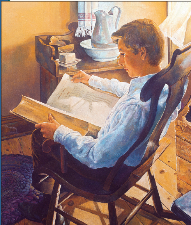
Samtang naghunahuna kon asa nga Simbahan ang apilan, si Joseph midangop sa Biblia alang sa giya. Dinha iyang nabasa, "Pangayo sa Dios."

Sukad nianang adlaw, si Joseph naghago sa pag-alagad sa Dios, naglihok aron sa pag-establisar sa Ang Simbahan ni Jesukristo sa mga Santos sa Ulahing mga Adlaw ug aron pagtukod sa gingharian sa Dios dinhi sa yuta sa kaulahiang mga adlaw. Ang matitud-anon nga mga miyembro sa Simbahan mopamatuod nga si Jesukristo mao ang Manluluwas ug Manunubos sa kalibutan. Si Jesus nagdumala sa Iyang Simbahan karon pinaagi sa pagpadayag ngadto sa usa ka propeta dinhi sa yuta. Si Joseph Smith ingon niana nga propeta. Bisan tuod nga si Joseph nakahimo og daghang mga butang