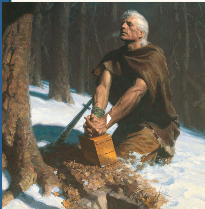
Pagka A.D. 421 ang propeta nga si Moroni milubong sa sagrado nga mga talaan sa iyang katawhan didto sa Bungtod sa Cumorah. Sa dihang mibalik siya sa kaulahian isip usa ka nabanhaw nga tawo, iyang giingnan si Joseph Smith kabahin sa karaan nga talaan, nga naglangkob sa kahingpitan sa ebanghelyo, sigun sa gihatag sa Manluluwas ngadto sa karaang mga lumolupyo sa kayutaan sa America. Kana nga talaan mao ang Basahon ni Mormon.

Human ikasulti kanako kini nga mga butang, siya misugod sa pagkutlo sa mga panagna