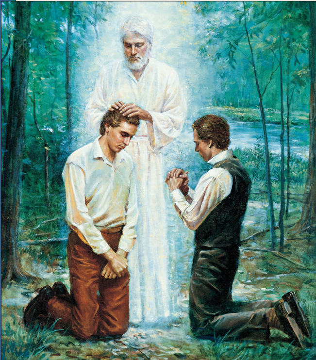
Si Joseph Smith ug si Oliver Cowdery midawat sa Aaronic Priesthood pinaagi sa pagpandong sa mga kamot gikan ni Juan Bautista miadtong 15 sa Mayo 1829.

K ami sa gihapon mipadayon sa buhat sa paghubad, sa diha nga, sa sunod nga bulan (Mayo 1829), kami usa ka adlaw niana nangadto sa kakahoyan aron sa pag-ampo ug pagpangutana sa Ginoo kabahin sa bunyag alang sa paghugas [kupasayloan] sa mga sala, nga kami nakabasa diha sa gihubad nga mga palid. Samtang kami nagbuhat sa ingon, nag-ampo ug nagtawag ngadto sa Ginoo, usa ka sulugoon nga gikan sa langit mikunsad sa usa ka panganod sa kahayag, ug samtang nagpandong sa iyang mga kamot kanamo, siya mi-orden kanamo, nag-ingon: