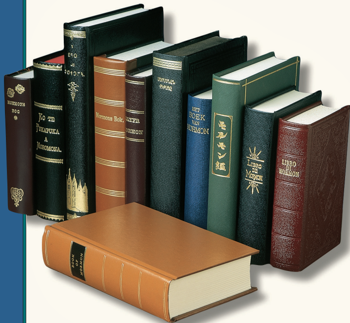
Ang Basahon ni Mormon, unang gi-imprinta pagka 1830, nga karon gimantala sa sobra sa 80 ka mga pinulongan sa tibuok kalibutan.

Alang sa mas hingpit nga asoy sa sugilanon ni Joseph Smith, tan-awa sa Joseph Smith—Kasaysayan nga anaa sa Perlas nga Labing Bililhon o sa History of the Church, 1:2–79.