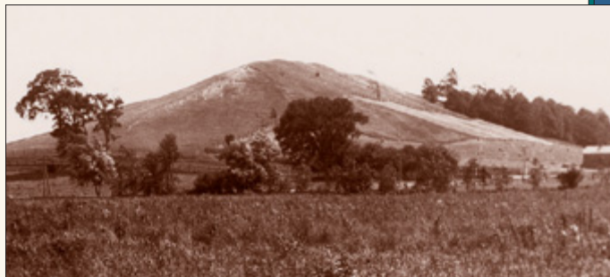
Хълмът Кумора се намира на около три мили югоизточно от фермата на сем. Смит в Палмира, Ню Йорк. По времето на Джозеф северната му страна била покрита с трева, а южната с разпръснати храсти и дървета. Плочите били заровени на югозападния склон, недалече от върха. Снимка: август 1907 г.

В този момент отпечатъкът върху съзнанието ми беше толкова дълбок, че сънят бе излягал от очите ми и аз лежах, преизпълнен с удивление от това, което бях видял и чул. Но колко голяма бе изненадата ми, когато аз отново съгледах същия пратеник до леглото си и го чух пак да разказва и преповтаря отново същите неща, както преди; и той добави едно предупреждение към мен, като ми каза, че Сатана щял да се опита да ме изкуши (като следствие от крайната бедност на бащиното ми семейство) да взема плочите с цел да забогатее. Това той ми забрани, като каза, че получавайки плочите, аз не трябва да имам нищо друго пред вид, освен да прославям Бога и да