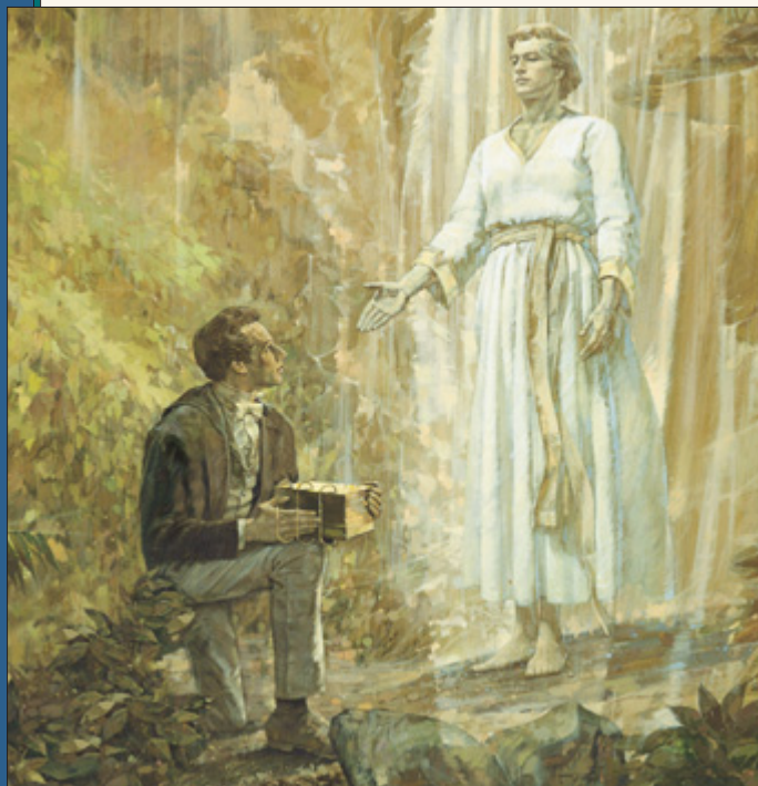
Мороний се връщал веднъж годишно в течение на четири години и давал напътствия на младия пророк. След тези четири години Джозеф получил плочите и започнал да превежда Книгата на Мормон.

Скоро след това аз станах от леглото си и както обикновено се отдадох на всекидневния труд; но опитвайки се да работя както друг път, аз почувствах силите си толкова изтощени, че не бях способен на нищо. Баща ми, който работеше заедно с мен, видя, че нещо