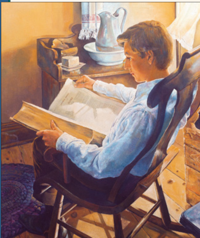
Докато се чудел към коя църква да се присъедини, Джозеф се обърнал към Библията за напътствие. Там той прочел "Искай от Бога".

От този ден Джозеф се труди в служба на Бог, като работи за установяването на Църквата на Исус Христос на светите от последните дни и за изграждането на Божието царство на земята в последните дни. Верни членове на Църквата свидетелстват, че Исус е Спасителят и Изкупителят на света. Исус ръководи Своята Църква днес чрез откровения към пророк на земята. Джозеф Смит е такъв