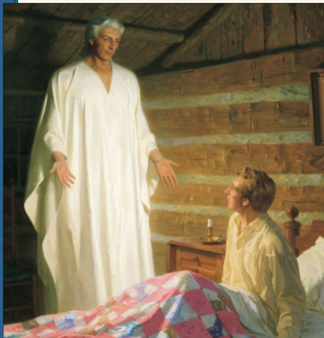
Три години след първото видение на Джозеф Смит Бог изпратил ангела Мороний да му даде указания за възстановяването на Евангелието на Исус Христос.

През нощта на гореспоменатия двадесет и първи септември, след като се бях уединил в леглото си за през нощта, аз се отдадох на молитва и смирено умоляване на Всемогъщия Бог за опрощение на всички мои грехове и простъпки, а също и за едно проявление, та да узная за положението и репутацията си пред Него, защото аз имах пълна увереност, че ще получа божествено проявление, тъй както преди бях имал такава.