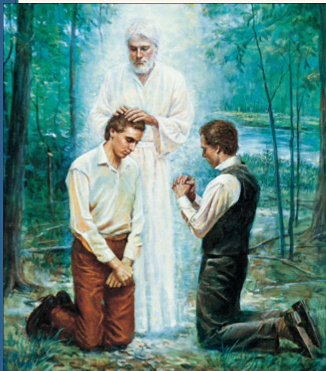
Джозеф Смит и Оливър Каудъри получили Аароновото свещеничество чрез полагане на ръце от Иоан Кръстител на 15 май 1829 г.

Ние все още продължавахме работата по превода, когато през следващия месец (май 1829 г.) един ден отидохме в гората, за да се молим и запитахме Господа относно кръщението за опрощаване на греховете, което ние намерихме, че се споменава в превода на плочите. Докато ние бяхме заети да се молим и призоваваме Господа, един пратеник от