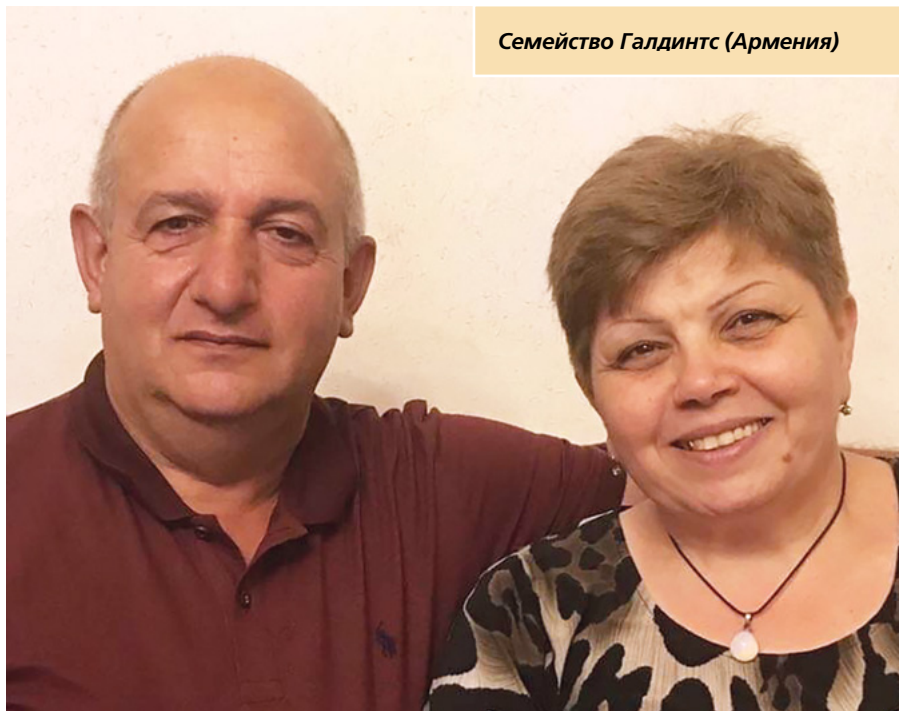
Семейство Галдунтс (Армения)

Поради плащането на пълен десятък синът ми беше благословен с възможността да отслужи пълновременна мисия. Преди да замине на мисия, той написа свидетелството си, в което каза как го