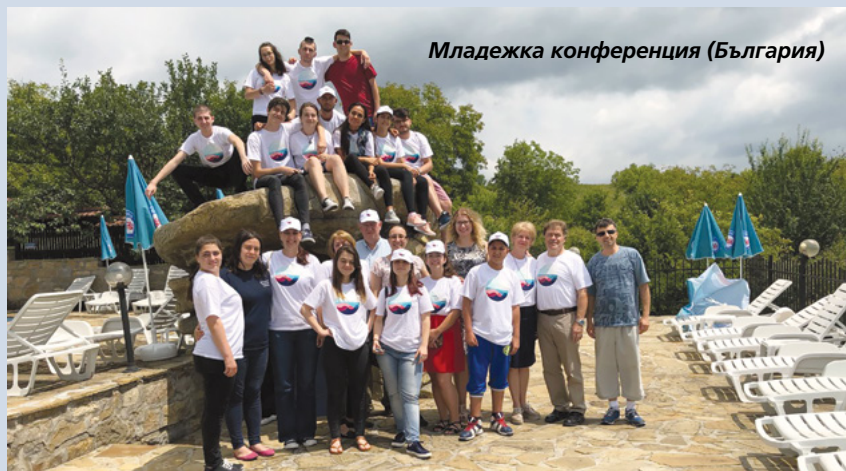
Младежка конференция (България)

ще направя, е да се подготвя духовно за своята мисия. Второто нещо е да получа своята патриархална благословия. След като отслужам мисия искам да сключая вечен брак в храма. Научих, че ако върша своята част, Небесният Отец ще ме благославя във всичко. Искам да кажа, че обичам всички младежи. Нещото, което искам да ги насърча, е да се подкрепят и да помагат за увеличаването на Божието дело!“ ■