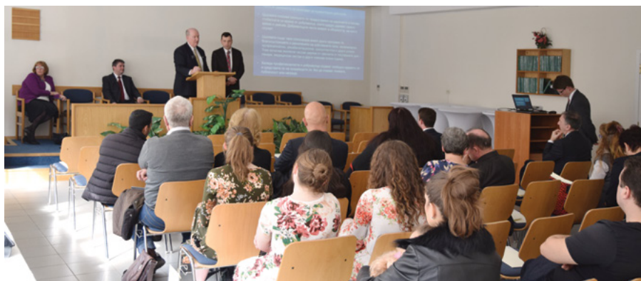
↑ Президент Дейвис говори на празненството по случай годишнината

представители от Университета по библиотекознание и информационни технологии, Църквата на адвентистите от седмия ден и неправителствената организация „Мостове“. Членове и мисионери от Църквата приветстваха гостите с добре дошли като изпълниха няколко музикални и инструментални творби.