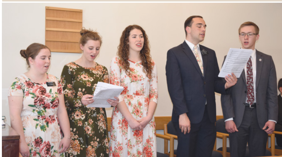
↓ Изпълнение от мисионерите