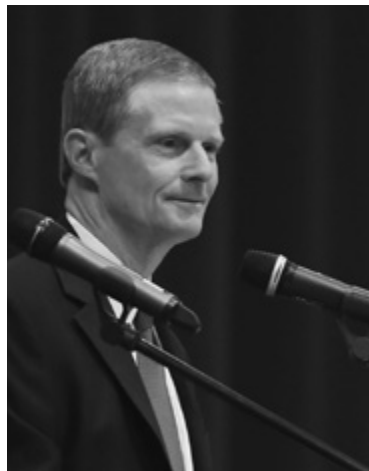
Старейшина Беднар изнася своята реч на конференция на кол Москва, Русия

По време на обучението беше наблегнато, че братята в своята служба трябва да обръщат максимално внимание на отделните членове и семейства в Църквата, а не само на различните църковни програми, образно казано – да се обръща внимание на скъпоценния бисер, а не на съда, в който бисера се съхранява. Църковните ръководители говориха и неблегнаха, че днес Господ сам ускорява Своето дело и че Божиите служители трябва да вървят с Неговото темпо, като получават напътствие от Него чрез лично откровение. ■