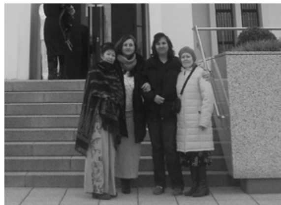
Сестри пред храма