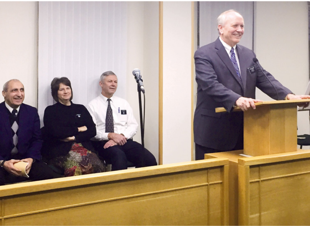
Նախագահ Բոսթրոմը գրուցում է Հայաստան Երևան շրջանի անդամների հետ

ավելի լավ պլանավորելի իմ գործերը և մեծարելի իմ կիրակնօրյա կոչումները: Ես երբեք չեի հարկադրի այդ պարտավորությունը մեկ ուրիշին, բայց այն օրինել է իմ կյանքը: