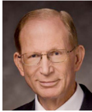
Երեց Բրյուս Դ. Փորթեր, ԱԵՏ կախազահ (մինչև 2016թ. դեկտեմբեր)

բան արեց այս աշխարհի մարդկանց փրկության համար, քան որևէ այլ մարդ, որը երբևէ ապրել է նրա վրա» (Վևու 135.3):