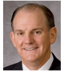
Նախագահ Մարտին, Արևելյան Եվրոպայի տարածաշրջանի նախագահի առաջին խորհրդական

Եկեղեցու և՛ նոր, և՛ հին անդամների համար ահա հինգ անելիքներ, որոնք կարող են փոխել մեր կյանքը: Մրանք Աստծո պատվիրաններ են և մեզ կօգնեն հավատարիմ