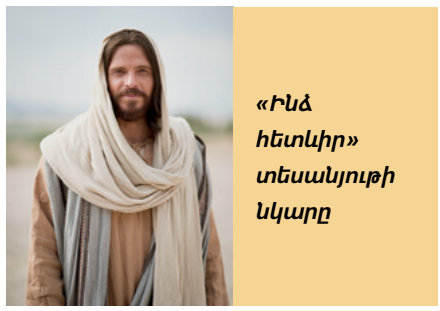
«Ինձ հետևիր» տեսանյութի նկարը

Մենք հորդորում ենք ծնողներին օգտագործել սուրբ գրությունները, the Gospel Art book-ը, "Children's Songbook"-ը, և երաժշտական CD-ներ, երբ տանը ուսուցանում են իրենց երեխաներին: Երբ ծնողները և երեխաները միասին երգում են Երեխաների Միության երգերը, նրանք զգում են Տիրոջ Հոգին: Զորավոր «Եկ, հետևիր ինձ» առցանց տեսանյութը ցույց է տալիս, որ տարածաշրջանի յուրաքանչյուր նպատակը կապված է Երեխաների Միության այն երգի հետ, որն ուսուցանում է այդ սկզբունքը: