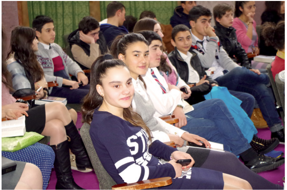
2016թ. Երիտասարդների համաժողովի մասնակիցները

Համաժողովի բոլոր ծրագրերը կազմակերպած էին այնպես, որպեսզի օգնեին երիտասարդներին հիշել Նեփիի խոսքերը. «Առաջ մղվեք Քրիստոսի հանդեպ հաստատամտությամբ, ունենալով հույսի կատարյալ պայծառություն, և սեր՝ Աստծո հանդեպ և բոլոր մարդկանց հանդեպ: Ուստի, եթե դուք առաջ մղվեք, սնվելով Քրիստոսի խոսքով, և համբերեք մինչև վերջ, ահա, այսպես է ասում Հայրը. Դուք կունենաք հավերժական կյանք» (2 Նեփի 31.20): ■