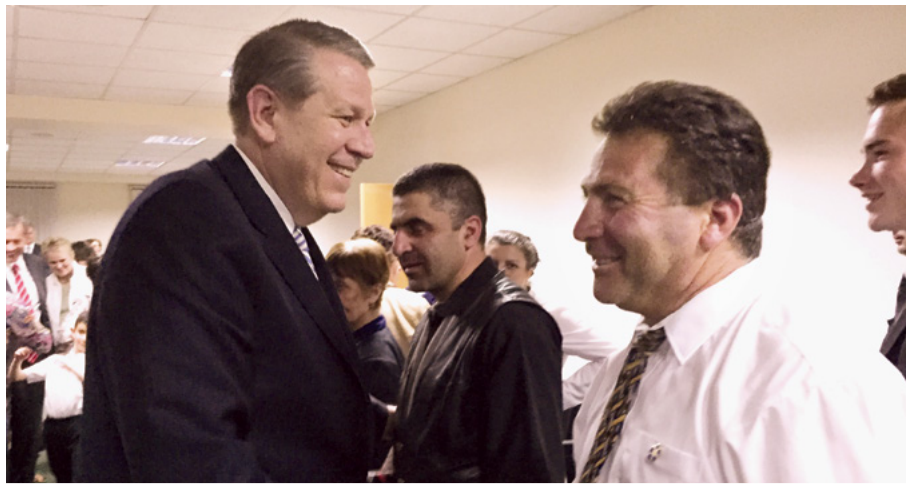
Նախագահ Հոլթերմոնը և մյուս հյուրերը ողջունում են անդամներին համաժողովից հետո

գործում: Նախագահ Հոլթերմոնը իր ուղերձում գովաբանեց եկեղեցու անդամներին, նշելով, որ նրանց մեծ մասը Եկեղեցուն միացած առաջին սերունդն է իր ընտանիքում և իր հավատարմությամբ հիմք է դնում գալիք սերունդների օրհնության համար: Նա խոսեց Եկեղեցու և Ավետարանի փոխկապվածության մասին: Որքան էլ որ Եկեղեցին հիանալի է իր կառուցվածքով, եթե Եկեղեցում ակտիվ լինելը մենք դիտում ենք որպես վերջնանպատակ, ապա վտանգ կա: Հնարավոր է ակտիվ լինել Եկեղեցում, բայց քիչ ակտիվ լինել ավետարանում: Ավետարանը հավերժական է, ավետարանի տարրերը, սովորաբար, քիչ նկատելի են և չափելու համար ավելի դժվար են, բայց հավերժական տեսակետից դրանք ավելի մեծ կարևորություն ունեն: Եկեղեցու նպատակն է՝ օգնել մեզ ապրել ավետարանով: Նա մանրամասնորեն անդրադարձավ փրկարար արարողություններին՝ խոսելով Մկրտության և Սուրբ Հոգու պարզևի, քահանայություն ստանալու, տաճարային արարողությունների մասին և կոչ արեց անդամներին մտածել հաջորդ արարողության մասին, որը նրանք դեռ չեն ստացել: Արարողությունները կատարելը և պահելը կօրհնի մեզ հավերժական կյանքով, որն Աստծո ամենամեծ պարգևն է: Մենք պետք է հավատարիմ մնանք, իսկ արարողություններն ու ուխտերը մեզ ուժ են տալիս համբերել մինչև վերջ: «Մեծ օրհնություն է ապրել այն ժամանակ, երբ երկրի վրա տասնհինգ ապրող առաքյալ կա, որոնք Տիրոջ մարգարեները, տեսանողները և հայտնողներն են և կրում են Աստծո քահանայության բոլոր բանալիները, իսկ ավագ Առաքյալը՝ Նախագահ Թոմաս Ս. Մոնտնը, լիազորված է գործադրելու բոլոր այդ բանալիները մարդկանց օրհնության համար», վկայեց Նախագահ Հոլթերմոնը: ■