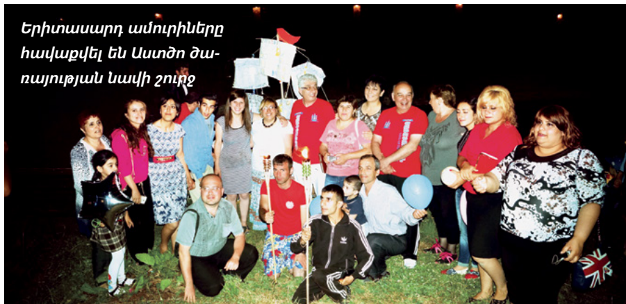
Երիտասարդ ամուրիները հավաքվել են Աստծո ծառայության նավի շուրջ

Ռուզաննա Ասուլյան, Արաբկիր ծուխ, Երևան Հայաստան ցից