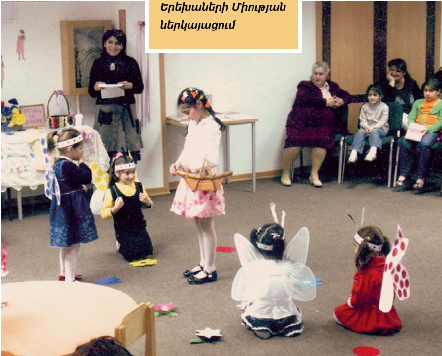
Երեխաների Միության ներկայացում

մատուցում են իրենց երգերն ու բեմադրությունները, որոնք նվիրված են Երկնային Հորը և Հիսուս Քրիստոսին: