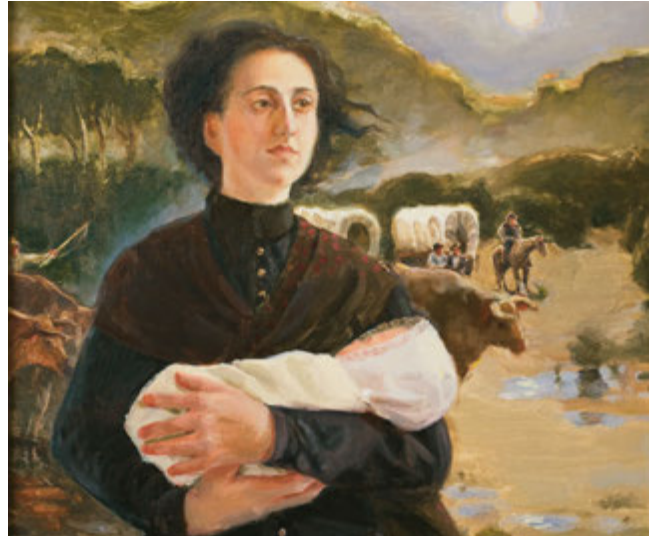
Մանկաբարձուհի. Քո շավիղները՝ նրա ընտրած ուղին. հեղինակ՝ Քրիստոպ Զոթեր.

Որքա՞նով են ինքնաապահով ձեր ծխի քույրերը: Ինչպե՞ս կարող եք զանազանել նրանց կարիքները: Եվ ով պետք է օգնի Սփոփող Միության նախագահին այս ջանքերում: Քանի որ սա աստվածային աշխատանք է և քանի որ Սփոփող Միության նախագահն աստվածային կոչում ունի, նա աստվածային օգնության արտոնություն ունի: Նա նաև բարի այցելող քույրերի կարիք ունի, որոնք հասկանում են մյուս քույրերի մասին հոգալու և խնամելու իրենց պատասխանատվությունը: Նրանցից և մյուս քույրերից ստացած հաշվետվությունների միջոցով, նա ի վիճակի է սովորելու նրանց կարիքների մասին: Նա կարող է նաև օգտագործել հանձնախմբերի և ավելի երիտասարդ քույրերի կարիքները, որոնք մեծ եռանդ ունեն և պատրաստ են ծառայելու: