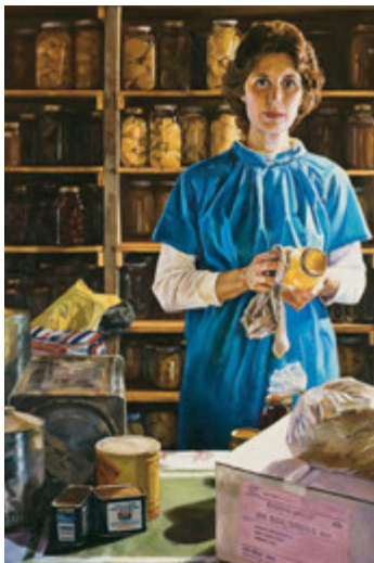
Մանդի պահուստով կինը. հեղինակ՝ Ջոդիթ Ա. Մեհր

«Ինքնաապահով լինել նշանակում է օգտագործել մեր Երկնային Հոր բոլոր օրհնությունները՝ հոգալու մեր մասին և մեր ընտանիքների մասին և լուծումներ գտնելու մեր սեփական խնդիրների համար»: 5 Մեզանից յուրաքանչյուրը պատասխանատվություն ունի փորձելու խուսափելու խնդիրներից նախքան դրանց տեղի կունենան և սովորելու հաղթահարել դժվարությունները, երբ դրանք վրա կհասնեն: