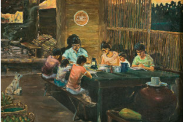
Ընտանեկան աղոթքը. հեղինակ՝ Արեւարդո Լորիս Լովենդինո.

Երկրորդ նկարը, որը կախված է իմ գրասենյակում, ցույց է տալիս, թե ինչպես կարող է այս սկզբունքը կիրառվել ամենուրեք: Այստեղ մենք տեսնում ենք Ֆիլիպինների մի ընտանիք՝ փայտե հենքերի վրա գետնից բարձր արմավենիների ցցերից պատրաստած իրենց հյուղում նստած: Առջևի մասում երևում է մեծ կծով լիքը ջուր: Նրանք ունեն մի զամբյուղ մանգո, որոշ չափով վառելիք՝ ճաշ պատրաստելու համար, և լույսի հասարակ աղբյուր, որով կարող են տեսնել: Նրանք նստած են ընթրիքի սեղանին՝ աղոթքի համար գլուխները խոնարհած: Պատի վրա կախված է ասեղնագործված բառեր՝ «Ընտանիքները հավերժ են»: Ես կարող եմ պատկերացնել, որ այս ընտանիքի մայրը ինքնաապահովման շատ սկզբունքներ և հմտություններ է սովորել այստեղ՝ Սփոփող Միության ժողովներում ու միջոցառումներում: