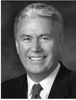
Deur President Dieter F. Uchtdorf Tweede Raadgewer in die Eerste Presidensie