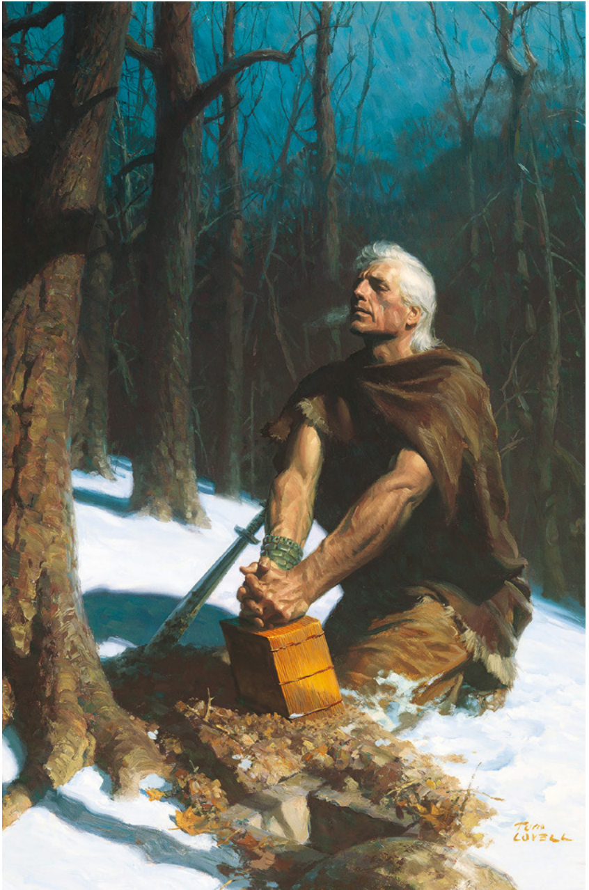
Moroni versteek die Nefitiese kroniek Skildery deur Tom Lovell Sien Mormon 8, bladsy 607–611