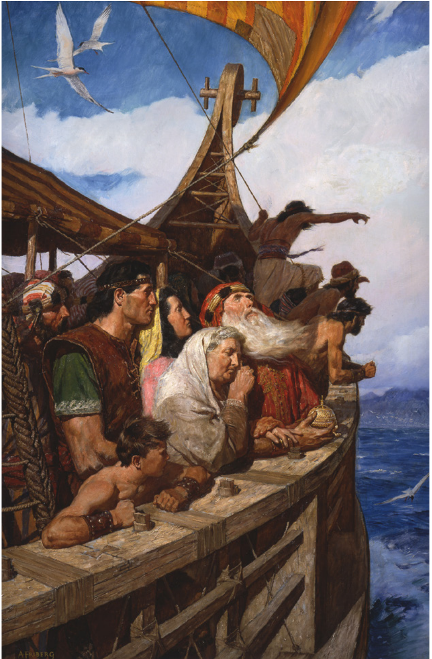
Lehi en sy mense kom in die beloofde land aan Skildery deur Arnold Friberg