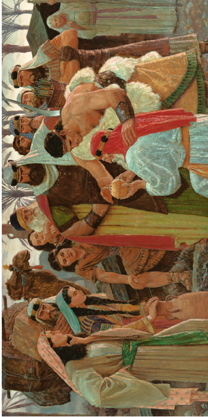
Lehi ontdek die Liahona Skildery deur Arnold Friberg Sien 1 Nefi 16, bladsy 42-45