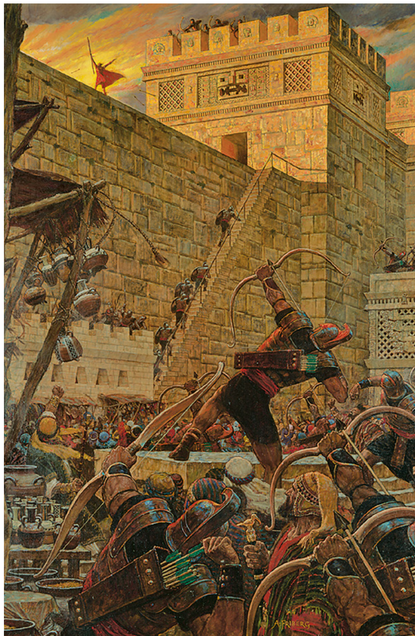
Samuel die Lamaniet profeteer Skildery deur Arnold Friberg Sien Helaman 16, bladsy 512–514