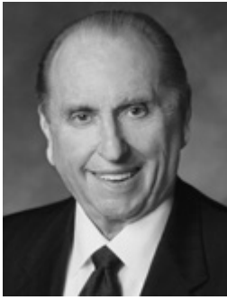
Deur President Thomas S. Monson