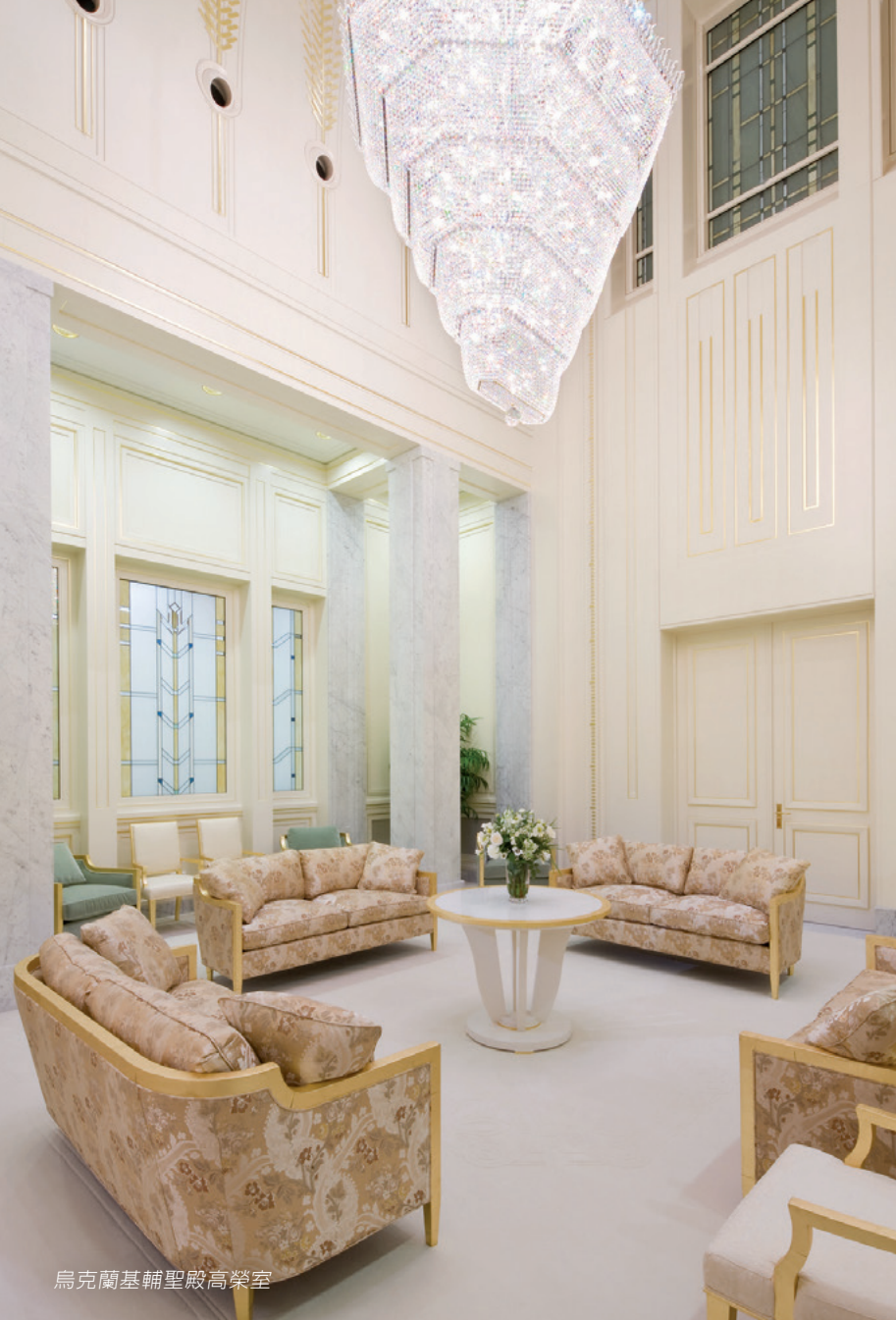
烏克蘭基輔聖殿高榮室