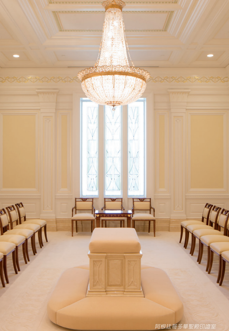
阿根廷哥多華聖殿印證室