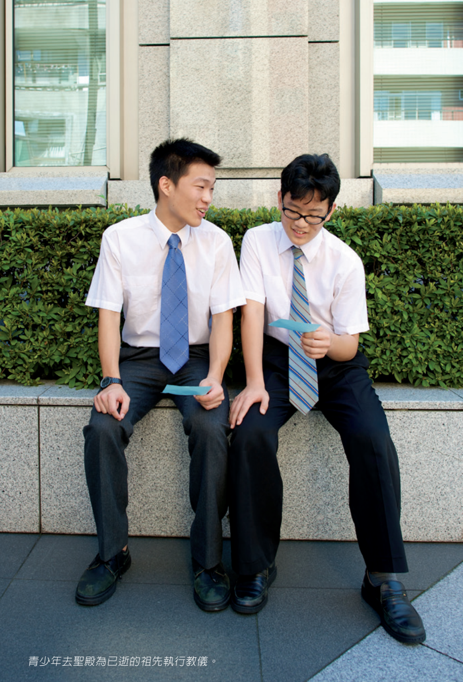
青少年去聖殿為已逝的祖先執行教儀。