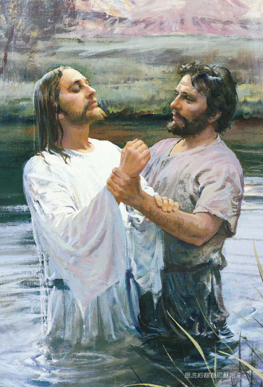
施洗約翰為耶穌施洗。