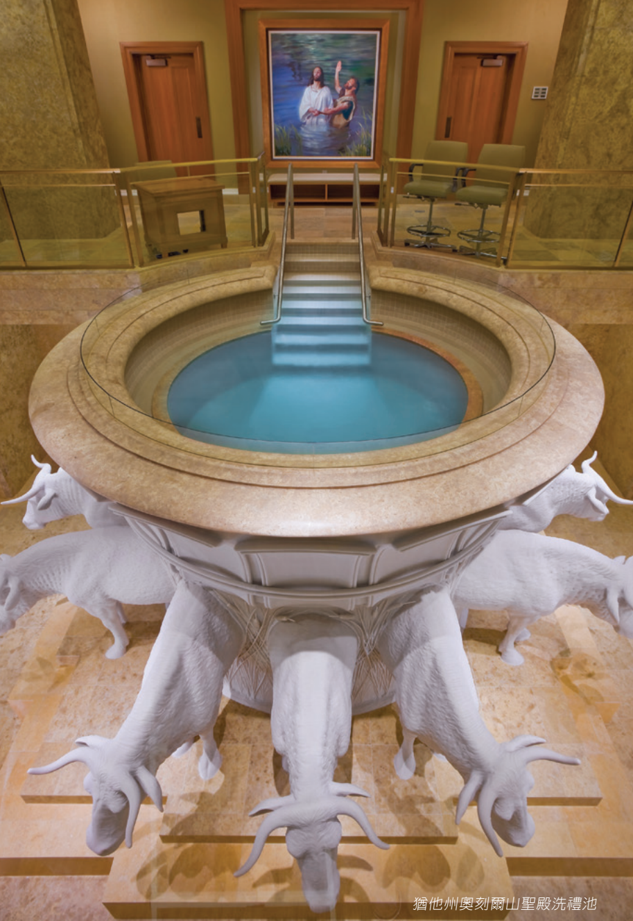
猶他州奧刻爾山聖殿洗禮池