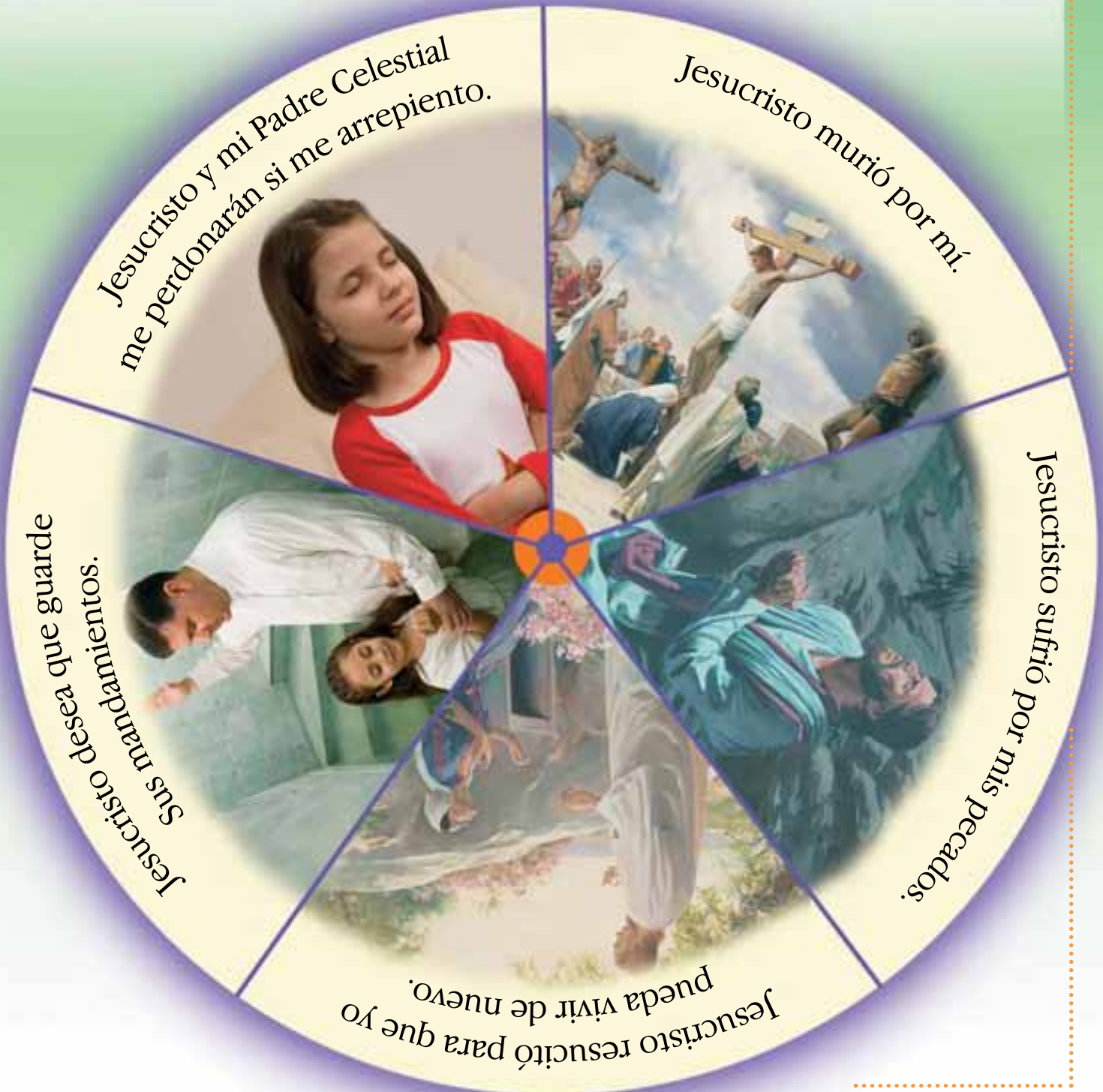
IZQUIERDA: DETALLE DE CRISTO VISTA LAS AMÉRICAS; POR JOHN SCOTT; DERECHA: EN DIRECCIÓN DE LAS AGUAS DEL RELOJ: FOTOGRAFÍAS POR MATTHEW REIER, TOMADAS CON MODELOS; LA CRUCIFIXIÓN; ILUSTRADO POR PAUL WANN; LA RESURRECCIÓN; POR HARRY ANDERSON.

cada una de las ilustraciones. Piensa en lo que dicha ilustración representa. Estos círculos con ilustraciones los podrías utilizar en un discurso de la Primaria o en una lección de la noche de hogar. ●