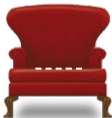
Thomas S. Monson Presidente