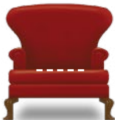
Jeffery R. Holland