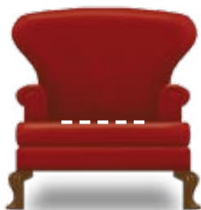
Henry B. Eyring Primer consejero