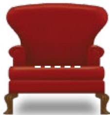
L. Tom Perry