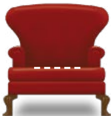
David A. Bednar