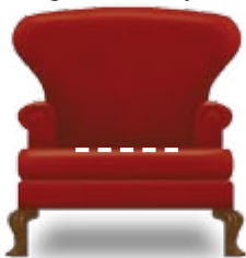
Russell M. Nelson