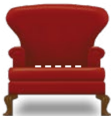
D. Todd Christofferson