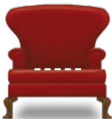
Dieter F. Uchtdorf Segundo consejero