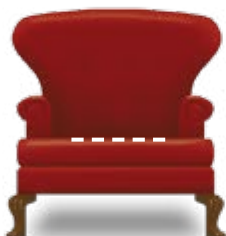
M. Russell Ballard