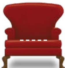
Richard G. Scott