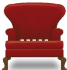
Quentin L. Cook