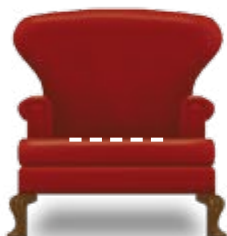
Dallin H. Oaks