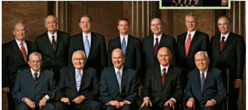
De "La doctrina de Cristo", Liahona , mayo de 2012, págs. 86–90.