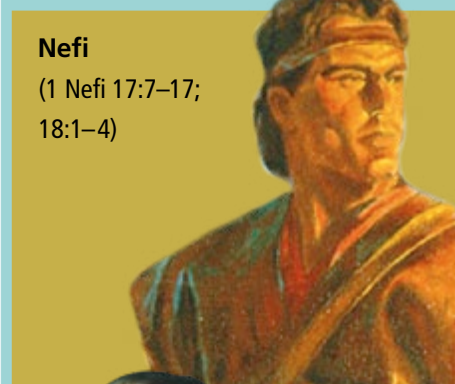
Nefi (1 Nefi 17:7–17; 18:1–4)

El Padre Celestial le dijo cómo hacer herramientas y construir un barco.