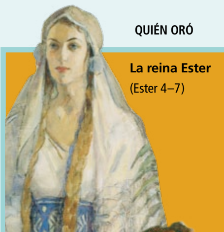
La reina Ester (Ester 4–7)

Tenían miedo de que su idioma cambiara y no se pudieran entender unos a otros.