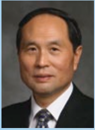
Por el élder Koichi Aoyagi De los Setenta