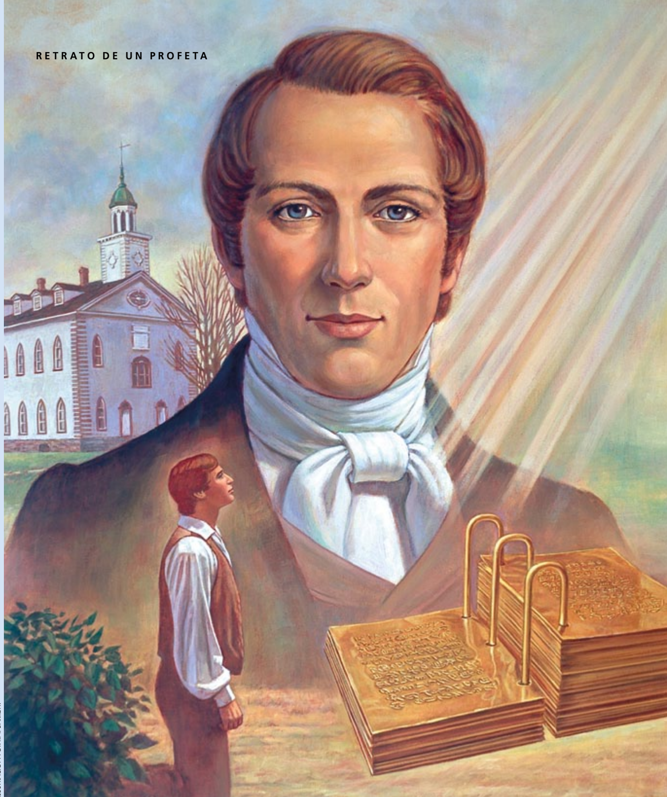
ILUSTRACIÓN POR R. T. BARRETT.