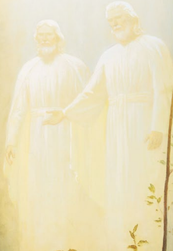
LA PRIMERA VISIÓN, POR GARY L. KAPP, PROHIBIDA SU REPRODUCCIÓN.

Las otras veces fueron cuando el Salvador visitó a los nefitas y cuando Él fue bautizado (véase 3 Nefi 11:7; Mateo 3:17).