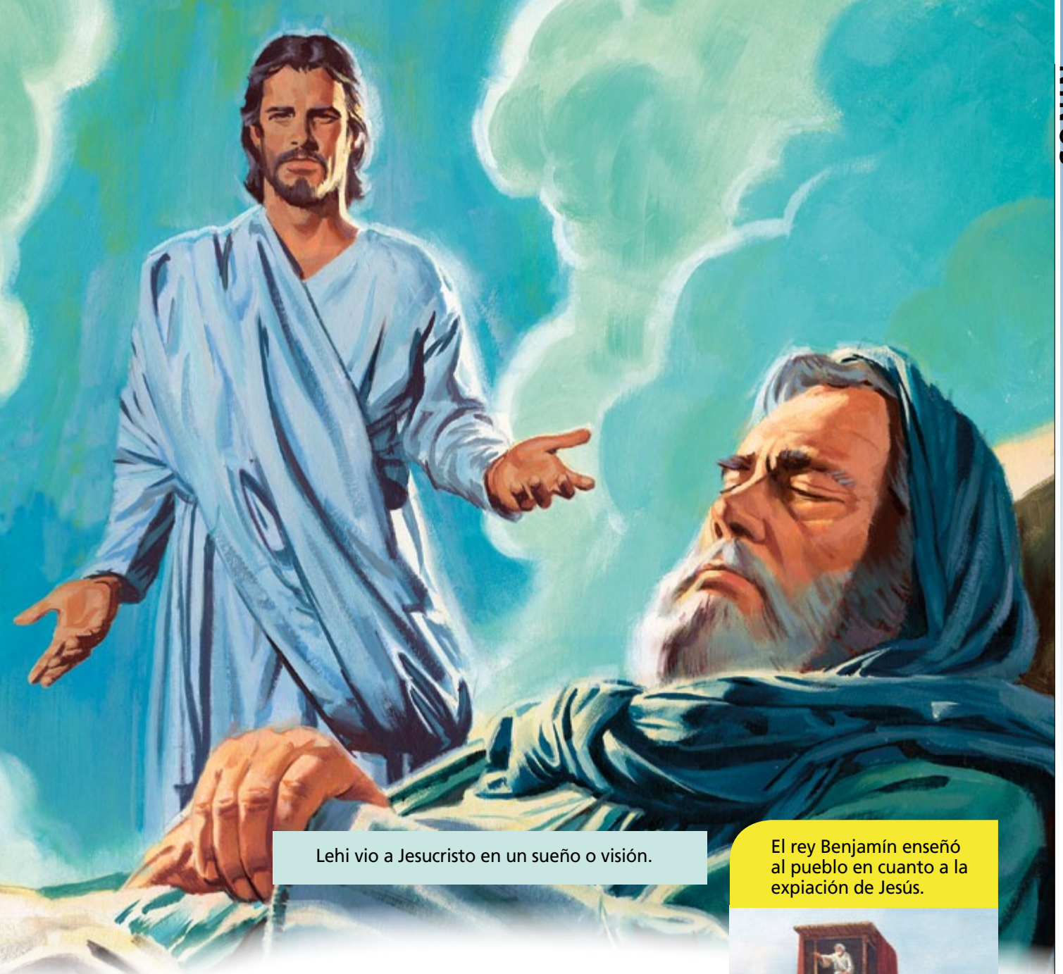
Lehi vio a Jesucristo en un sueño o visión.